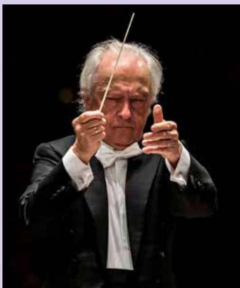
Antoni Wit