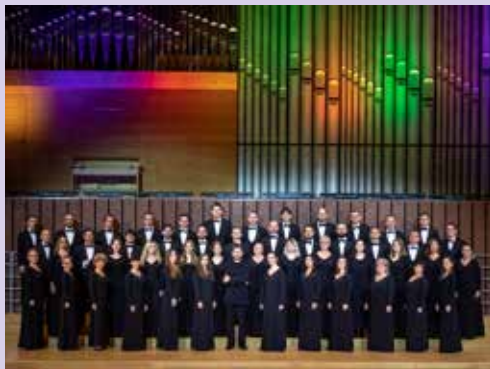
Chór FŁ