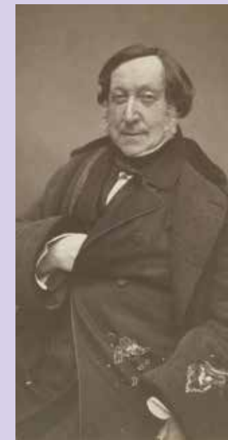
Gioacchino Rossini