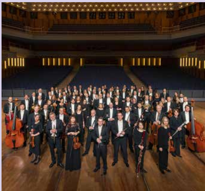
Robert-Schumann-Philharmonie