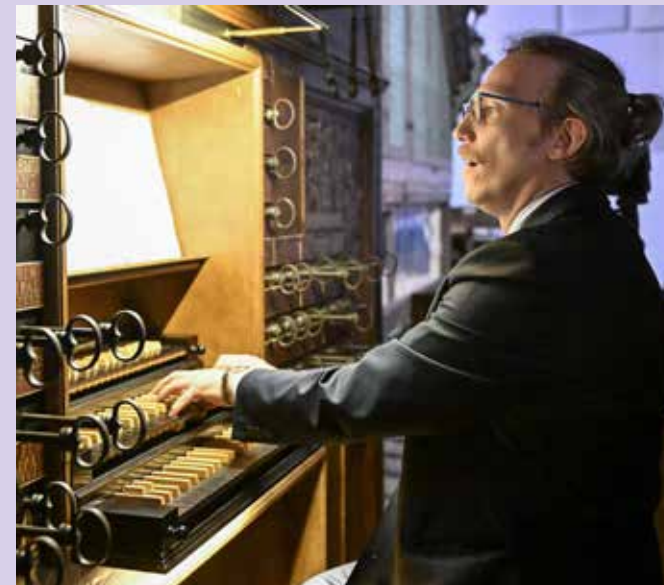
Andrzej Szadejko, fot. z archiwum artysty