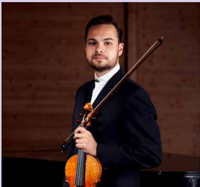
Dalibor Karvay

Wykonawcy: Dalibor Karvay – skrzypce/ dyrygent Orkiestra Symfoniczna FŁ