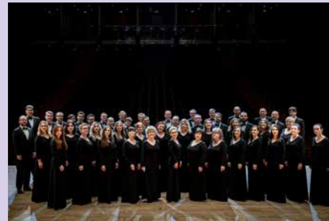
Chór FŁ