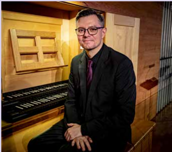
Krzysztof Urbaniak