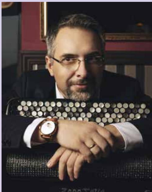
Klaudiusz Baran, fot. z archiwum artysty