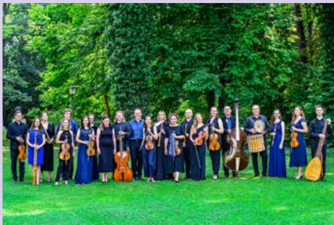
Altberg Ensemble